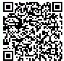
Q R code